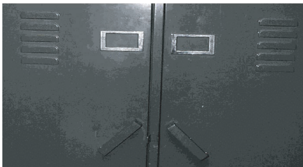
Detalhe da ventilação (figura ilustrativa)